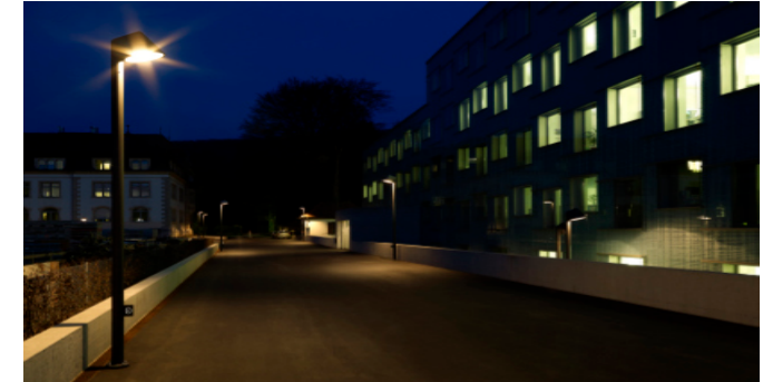
Projekt: Hauptsitz AXPO, Baden (AG)