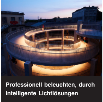
Professionell beleuchten, durch intelligente Lichtlösungen

Natürliches und künstliches Licht hat einen grossen Einfluss auf das Wohlbefinden und auf die Leistungsfähigkeit des Menschen. Unsere Lichtarchitektur basiert immer auf den Ansprüchen der Nutzer und verbindet hohe Designansprüche mit einer innovativen, energieeffizienten Technologie. Die Lichtplanung von d'amato+partner ist herstellerunabhängig. Unsere Kunden haben damit jederzeit Gewähr, die für sie beste Lösung zu erhalten.