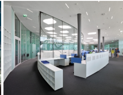
Projekt: Maison de la Paix, Genf (GE)